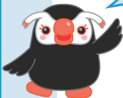
北方領土エリカちゃん