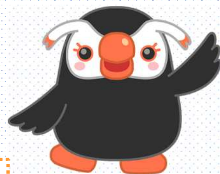
北方領土イメージキャラクター エリカちゃん

主催 ：北方領土返還要求愛知県民会議 後援 ：内閣府北方対策本部、外務省、 (独)北方領土問題対策協会、愛知県